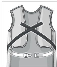
Gurtbandverschluss mit Schnappverschluss Serienmäßig, frontseitig.

Beim Modell RA641 stehen Ihnen zwei unterschiedliche Varianten zum Schließen der Schürze zur Auswahl.